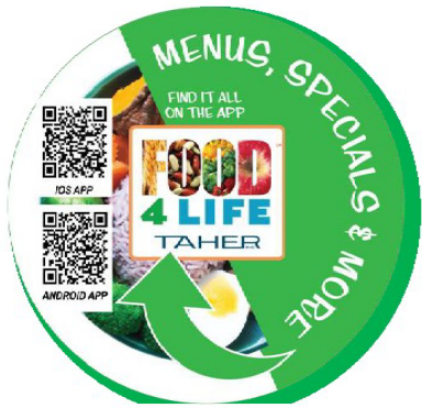
The Food4Life app is accessible through Alexa so you can ask for the daily menu.

For Parents & Students at Clinton Community School District